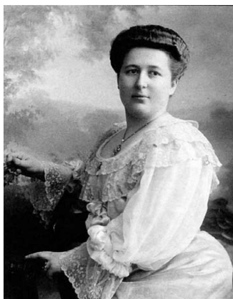
Mikołaj (1861–1917) i Zofia von Buentingowie