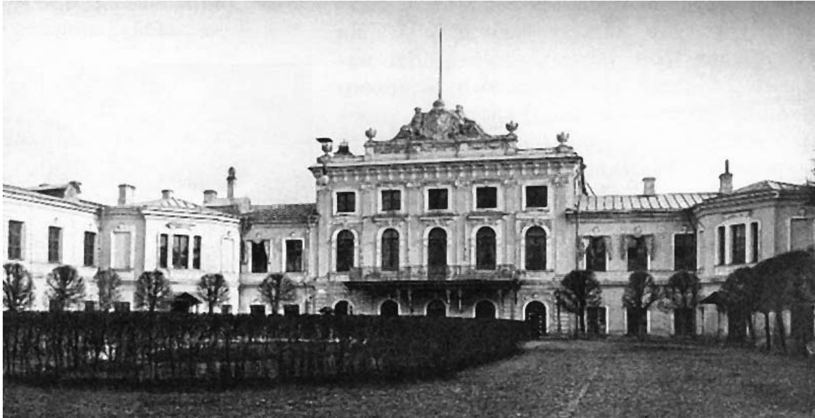
Pałac gubernatora w Twerze